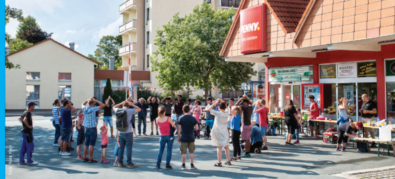
Einmal im Monat treffen sich die Anwohner*innen zum Spiel- und Begegnungsnachmittag auf dem Parkplatz des Supermarktes.