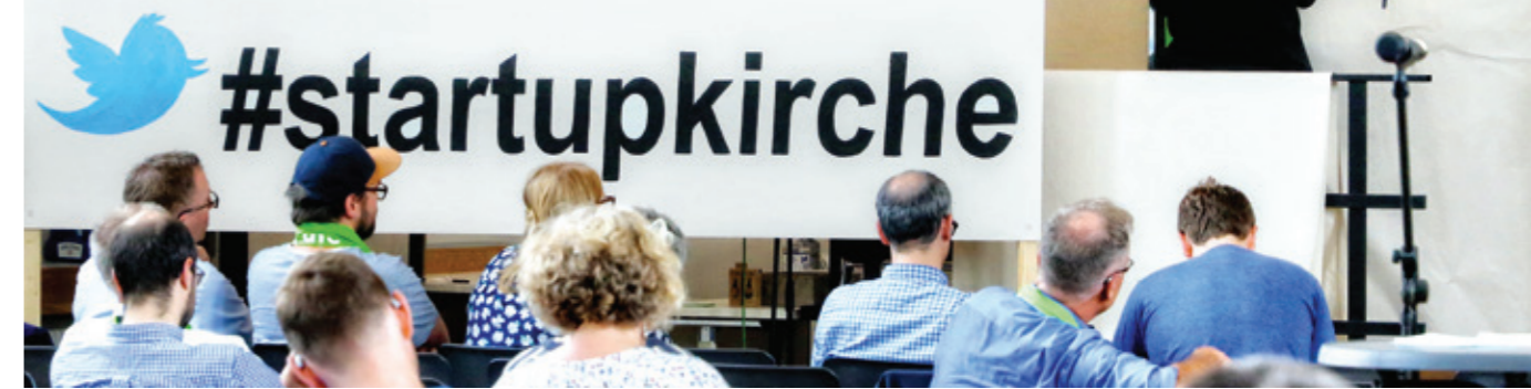
#startupkirche; 37. Deutscher Evangelischer Kirchentag Dortmund 2019

Gegründet wurde der Kirchentag im Jahr 1949. Wer aber hatte die Idee zu einem Kirchentag? Welche Herausforderungen standen am Anfang? Die Wurzeln liegen im Widerstand gegen den Nationalsozialismus, im Widerspruch gegen die deutsche Teilung, in der kirchlichen Erneuerung durch die internationale Ökumene. Persönlichkeiten aus Kirche und Gesellschaft, vor allem Reinold von Thadden, brachten die Idee Kirchentag voran. Wer die Gründerpersönlichkeiten waren und was sie bewirkten, zeigt dieser Band auf. Mit bisher unbekanntem Quellen werden die Anfänge des Deutschen Evangelischen Kirchentages freigelegt.