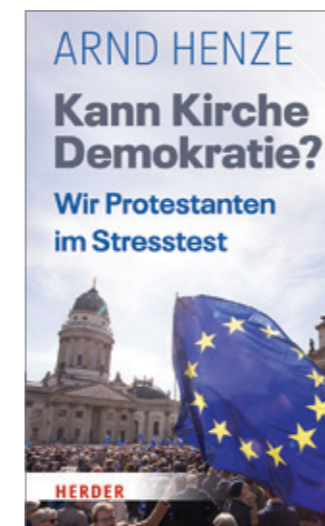
Arnd Henze: „Kann Kirche Demokratie? Wir Protestanten im Stresstest“, Verlag Herder, 1. Auflage 2019, 176 Seiten, 18 Euro

Trotzdem ist das Fragezeichen im Titel berechtigt und dieses Buch unbedingt lesenswert. Es provoziert: Es ruft die protestantische Kirche heraus aus gesellschaftlichen Nischen und hinein in eine gesamtgesellschaftliche Verantwortung, die wir annehmen müssen – meine ich. Es lohnt, mit Henze nach antidemokratischen Spuren in Geschichte und Gegenwart der evangelischen Kirchen zu suchen. An mancher Stelle ist man vielleicht angefasst oder erschrocken. Henze kann deutliche Sprache. Dabei muss man nicht jeder seiner Analysen folgen.